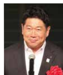
川崎市長 福田紀彦氏