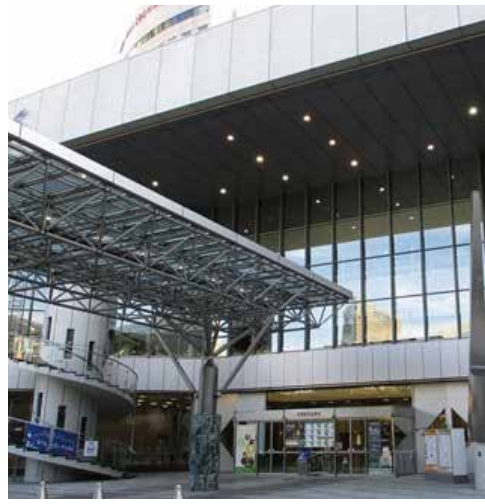
石川県立音楽堂コンサートホール

また中止の意見もあつたが、十分な準備ができていないこともあるかとは思いますが、精いっぱい努めて参ります。皆様の石川県へのご来県をお待ちしております。 せられ、被災の思いが寄る。