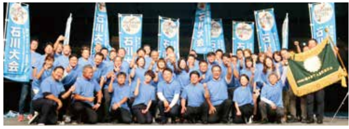
震災に負けじと元気いっぱいアピールする石川県PTA連合会のメンバー

さらなる一歩を踏み出せる自分の存在と、PTAの縁を生かして活動する価値とを再発見し、明日の活力源となることを願う講演されました。