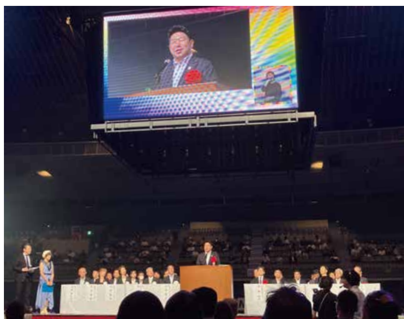
100周年を迎えた川崎市の街への想いとPTAへのエールを熱く語る福田市長

今年川崎で、そして来年は石川県で開催されると聞きました。ぜひ大会二日間、実りのあるものとなって、来年は被災地となっている石川県で、子供たちに元気を届けて、そして元気な石川県の子供たちの姿を全国に発信する。そのようなステップとなる大会になることを、心から祈念しています。