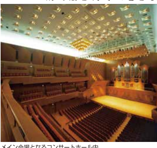
メイン会場となるコンサートホール内

大会開催にあたって 本年元日に能登地方を震源とする能登半島地震により想像を超える被災状況の中、被災地を離れて前例のない中学生の集団避難も行われました。少しづつ復旧復興が進んでいますが、地元を離れざるを得ない会員も少なくあり ません。このようなかたは、全国大会を開催すべきか、また、開催が可能なのか、県内市町の会長から意見を聞き協議を重ねました。当初は開催延期