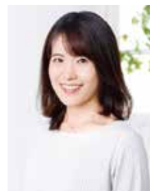
講師 内田 由紀子氏

京都大学こころの未来研究センター教授。専門は文化心理学・社会心理学。1998年、京都大学教育学部教育心理学卒業。2003年、京都大学大学院人間・環境学研究科博士課程修了。博士(人間・環境学)。ミシガン大学、スタンフォード大学の客員研究員等を経て、2008年より京都大学の教員として研究活動に従事。2019年より教授、2023年より研究院長。国際的な研究活動とともに、2010年から2013年まで内閣府「幸福度に関する研究会」委員。日本のウェルビーイング政策にも携わる。2014年「たちばな賞」(京都大学最優秀女性研究者賞)、2016年日本心理学会国際賞(奨励賞)受賞。