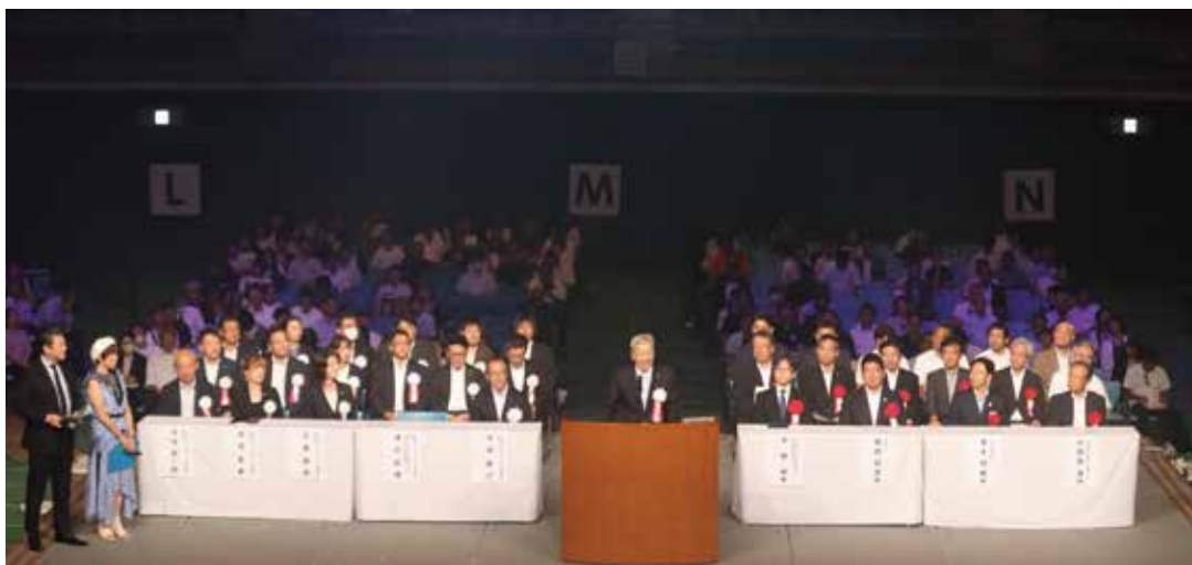
川崎大会開会行事の様子