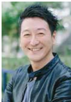
堀潤氏 NPO法人8bitNews代表理事／株式会社GARDEN代表／ 社会教育振興総括官

1997年兵庫県生まれ。立教大学文学部ドイツ文学科卒業後、2001年NHK入局。アナウンサーとして「ニュースウォッチ9」リポーター、「Biz スポ」キャスター等、報道番組を担当。2012年市民ニュースサイト「8bitNews」を立ち上げる。2013年4月1日付でNHKを退局。現在は、ジャーナリスト・キャスターとして独自の取材や報道・情報番組、執筆など多岐に渡り活動している。淑徳大学文学部客員教授、「For bes Japan」オフィシャル コラムニスト。2019年から、早稲田大学グローバル科学知融合研究所招聘研究員に就任、SDGs フロンティアラボで官民の枠を超えたイベントや情報発信を企画している。2020年、自身で監督、出演、制作を行った映画「わたしは分断を許さない」を公開。